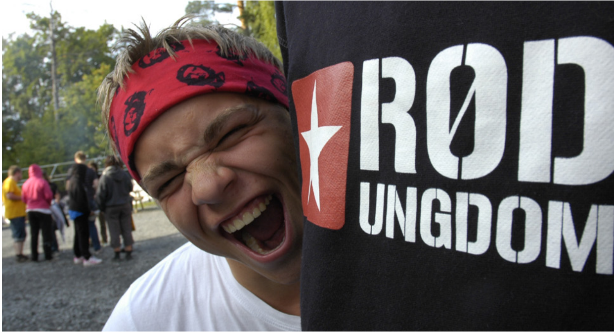
Jubilant: Rød Ungdom er 50 år og nå skal organisasjonen gi ut bok om historia.