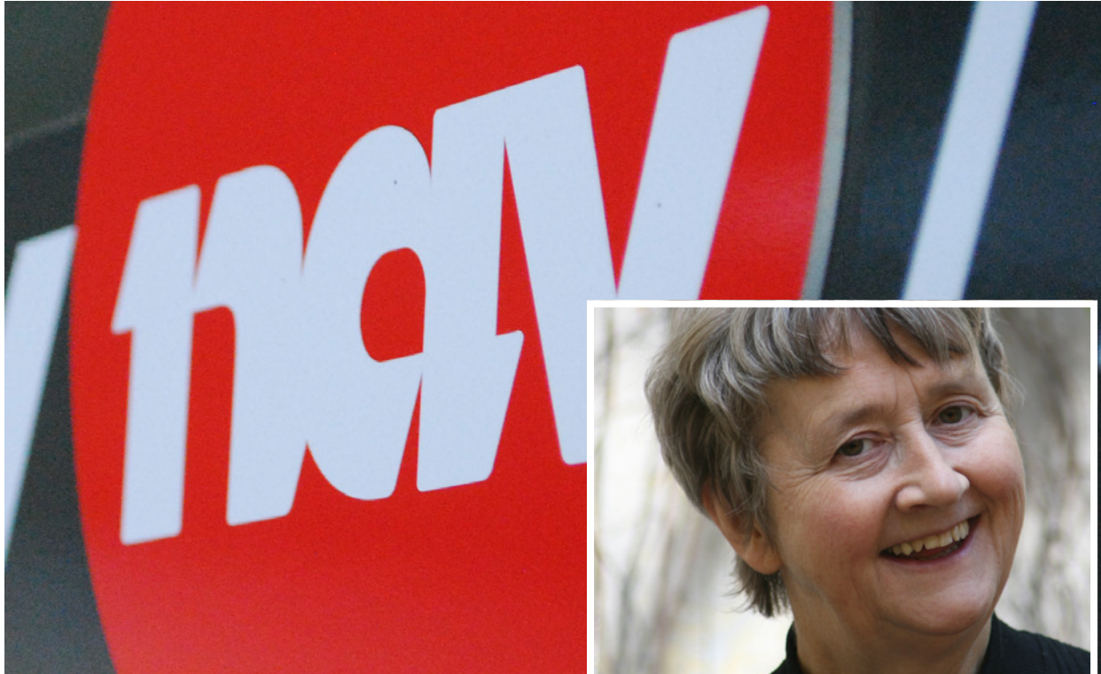
NAV: Møtet med NAV er vanskelig for mange langtidssjuke.