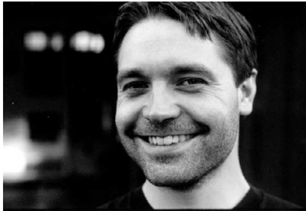
Journalist: Pål Hellesnes.

– Jeg vil basere meg både på offisielle dokumenter av typen referater og eksternt materiell, og intervjuer med nøkkelpersoner. I tillegg håper jeg at det kommer inn stoff fra mange av de som har en fortid i RU.